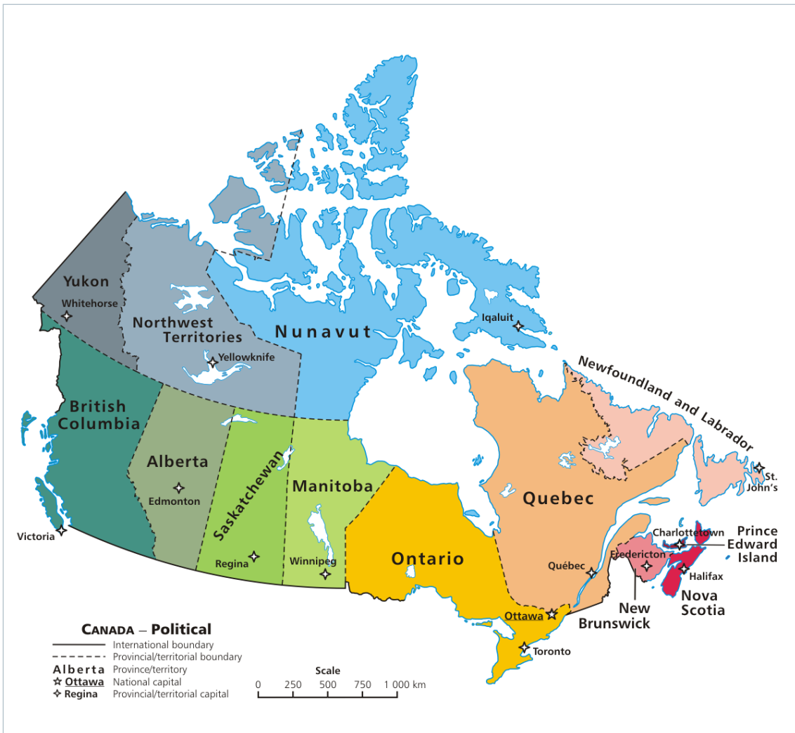
Imagen 2. División política, extraída de http://commons.wikimedia.org/wiki/File:Political_map_of_Canada.png?uselang=es